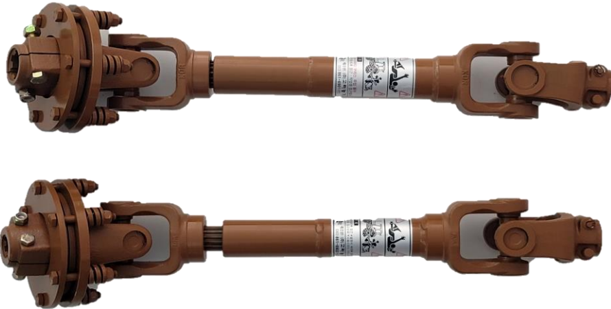
Ball Clutch Type U. J. (볼클러치 유니버설 조인트)

전달동력 조절이 가능하고 큰 동력전달이 가능하며 과부하를 흘려보내고 과부하가 해소되면 원상복귀되어 안전하고 내구성이 반 영구적임